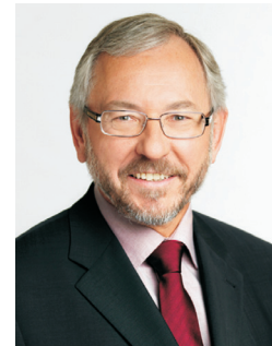
Rudi Schicker Stadtrat für Stadtentwicklung und Verkehr

Für Ihre Veranstaltung wünsche ich Ihnen viel Erfolg, gute Diskussionsbeiträge und hoffe, dass Sie von den zahlreichen Vorträgen profitieren können. Nützen Sie auch die eine oder andere Möglichkeit, um sich unser schönes Wien anzusehen und sich verzaubern zu lassen.